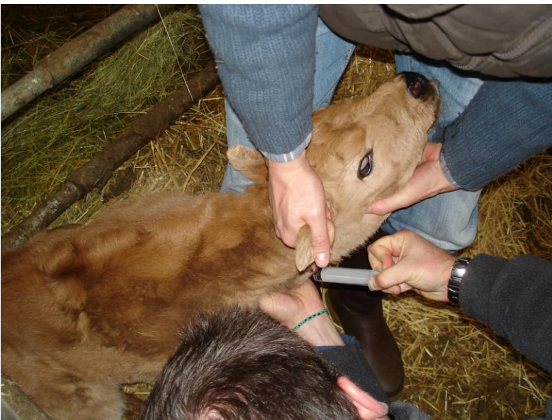
Prélèvement sur un veau lors d'une visite d'appui technique